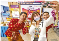
泰国迎来首个中国出境旅游团