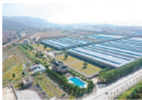
中印尼“两国双园”探索合作新路径