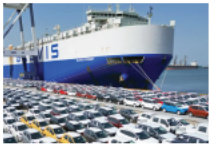
通讯：在非洲大地上，