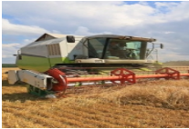
白俄罗斯粮食收获季