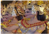
“万里迎春归 山海竞呈祥”活动圆满收官