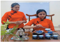
以茶为媒，推动文明交流互鉴