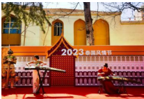
2023年泰国风情节在北京举行