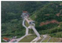
鹰厦铁路全线最长隧道