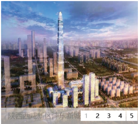
陕西西咸新区沣东新城