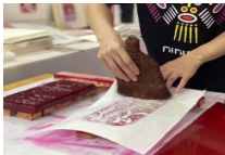
中外文化“潮玩”齐聚内蒙古